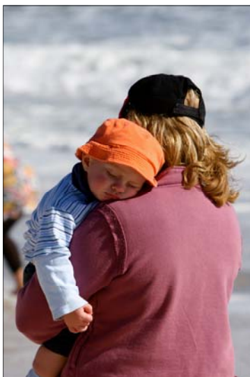
Tekst: Vivi Smedsgaard og Camilla Odgaard Lund - Layout: Berit Kjølhede